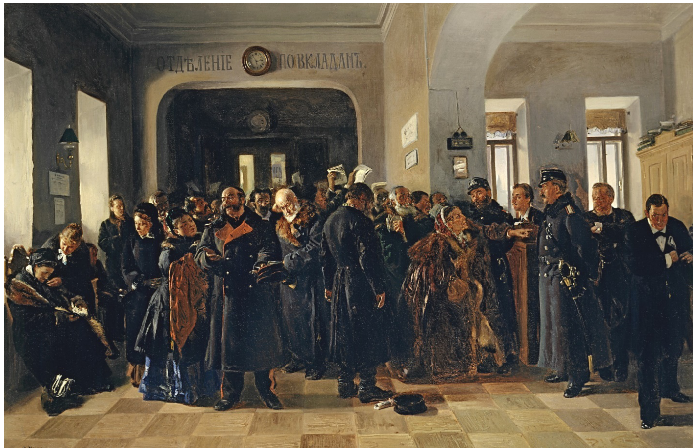
В. Маковский. «Крах банка», 1881, Государственная Третьяковская галерея

Максимальное количество баллов за задание - 16 баллов .