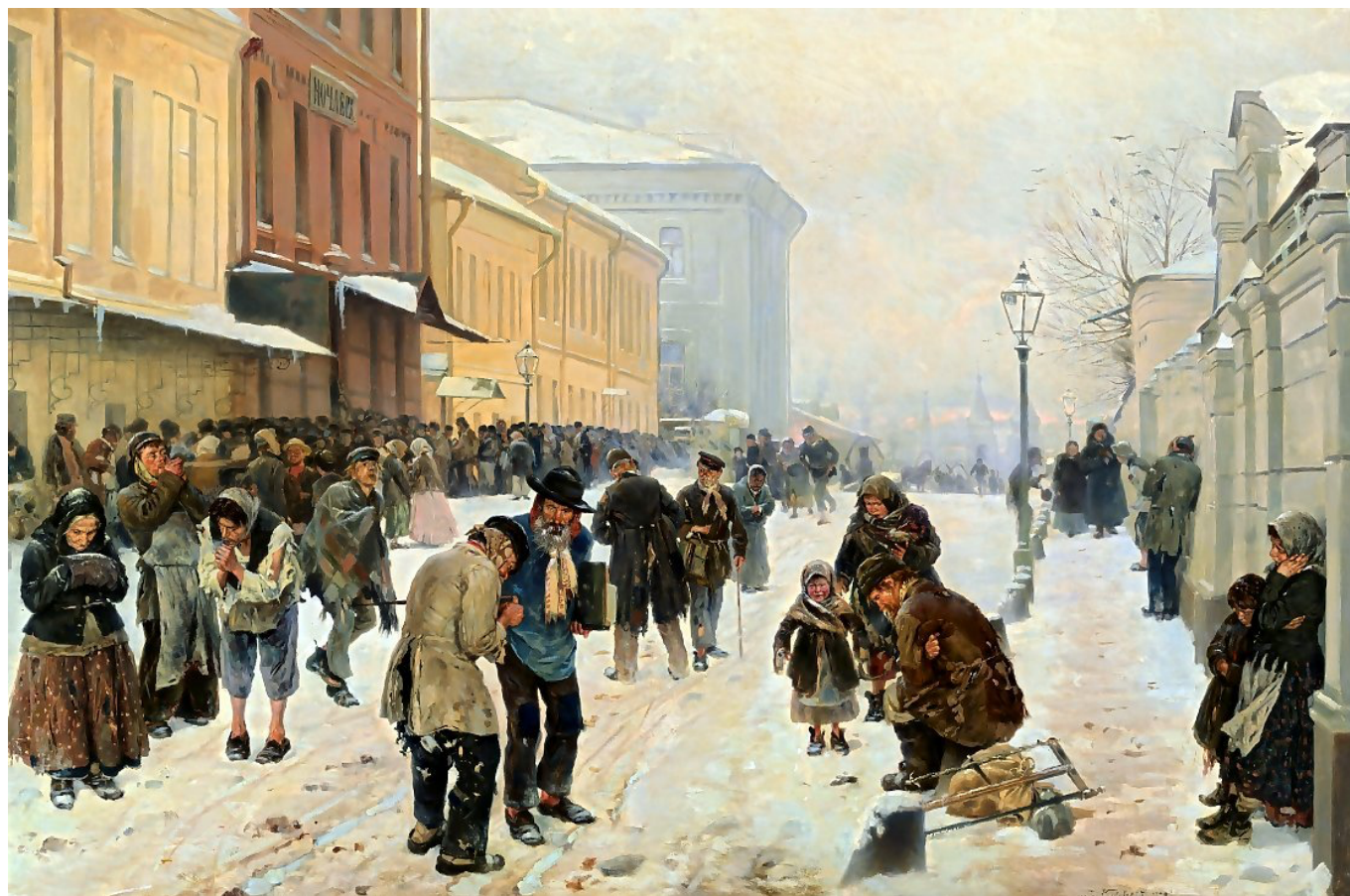
В. Маковский. «Ночлежный дом в Москве», 1889, Государственный Русский музей

Максимальное количество баллов за задание - 16 баллов .