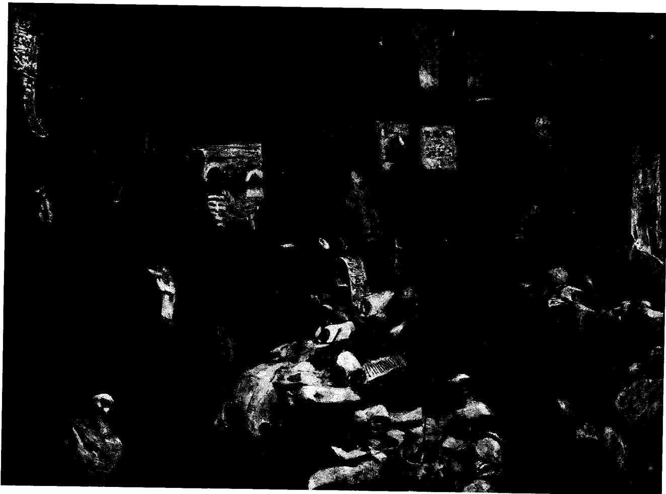
«В Приказе московских времен» 1907 Иванов С.В.

Максимальное количество баллов за задание - 16 баллов.