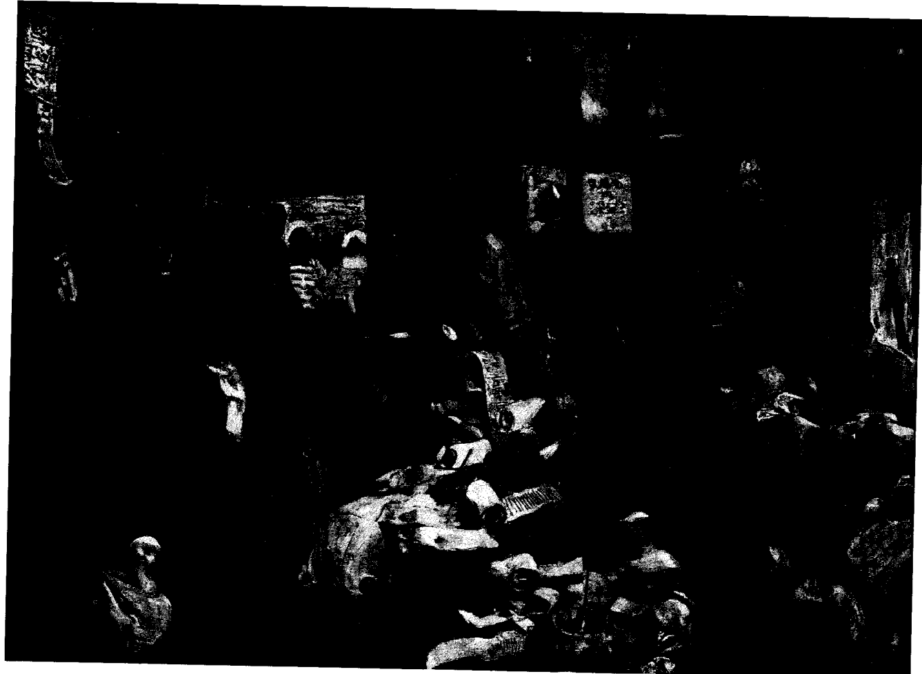
"В Приказе московских времен" 1907 Иванов С.В.

V. Проанализируйте визуальный источник и текст, содержащий историческую информацию, и ответьте на следующие вопросы. Максимальное количество баллов за задание - 16 баллов.