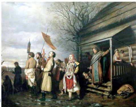
В.Г. Перов. «Сельский крестный ход на Пасхе» 1881. Государственная Третьяковская галерея

Ответ впечатйте в соответствующее поле под вопросом. Максимальное количество баллов за задание - 16 баллов.