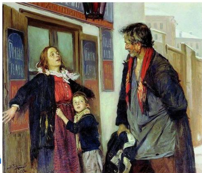
В. Маковский, «Не пущу!» 1892 г.

Максимальное количество баллов за задание - 16 баллов.