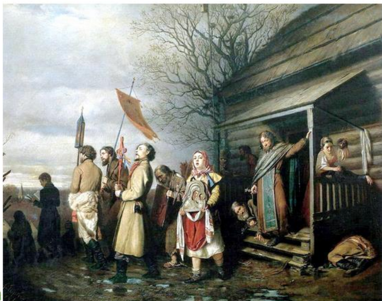
В.Г. Перов. «Сельский крестный ход на Пасхе» 1861, Государственная Третьяковская галерея

Перед вами одна из самых неоднозначных работ русского живописца Василия Григорьевича Перова «Сельский крестный ход на Пасхе», написанная им вместе с картиной «Проповедь в селе» для конкурса Академии художеств в 1861 году. И если за полотно «Проповедь в селе» он получил Большую золотую медаль Академии и право поездки в качестве пенсионера за границу, то вторая картина вызвала бурю негодования и горячие споры в обществе. Перова обвиняли в «нигилизме» от искусства, в оскорблении всего православного мира, утверждали, что подобные «карикатуры» убивают настоящее высокое искусство, унижают его, показывая только неприглядную сторону жизни.