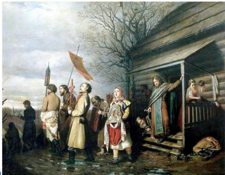
В.Г. Перов. «Сельский крестный ход на Пасхе» 1861, Государственная Третьяковская галерея

Максимальное количество баллов за задание - 16 баллов.