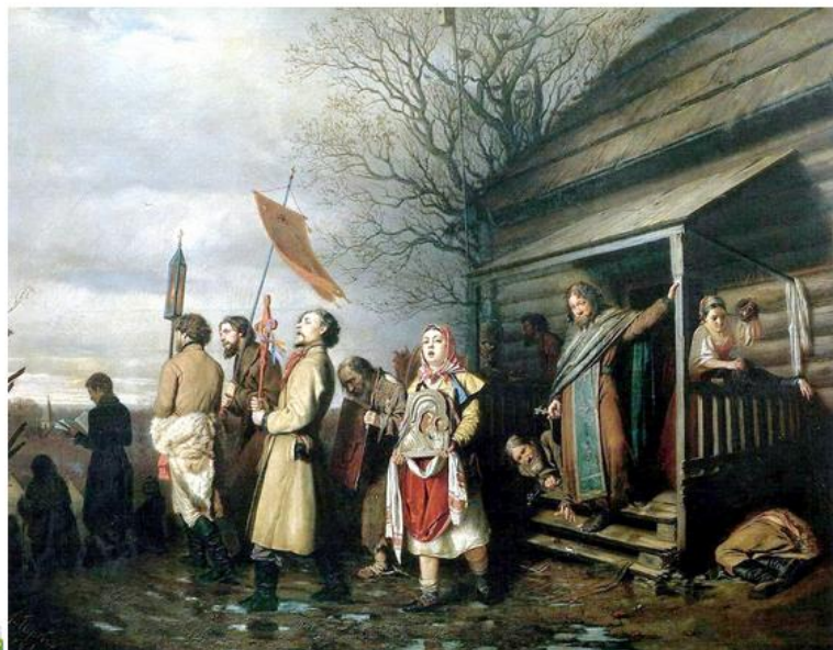
В.Г. Перов. «Сельский крестный ход на Пасхе» 1861, Государственная Третьяковская галерея

Максимальное количество баллов за задание - 16 баллов.