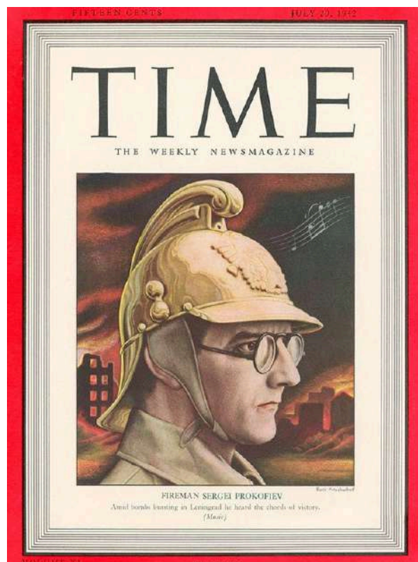
Обложка журнала «TIME» 1942 года, посвященная автору «Седьмой симфонии» Сергею Прокофьеву