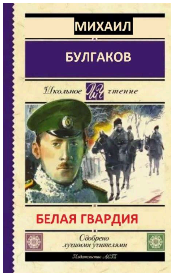
Обложка книги о Гражданской войне