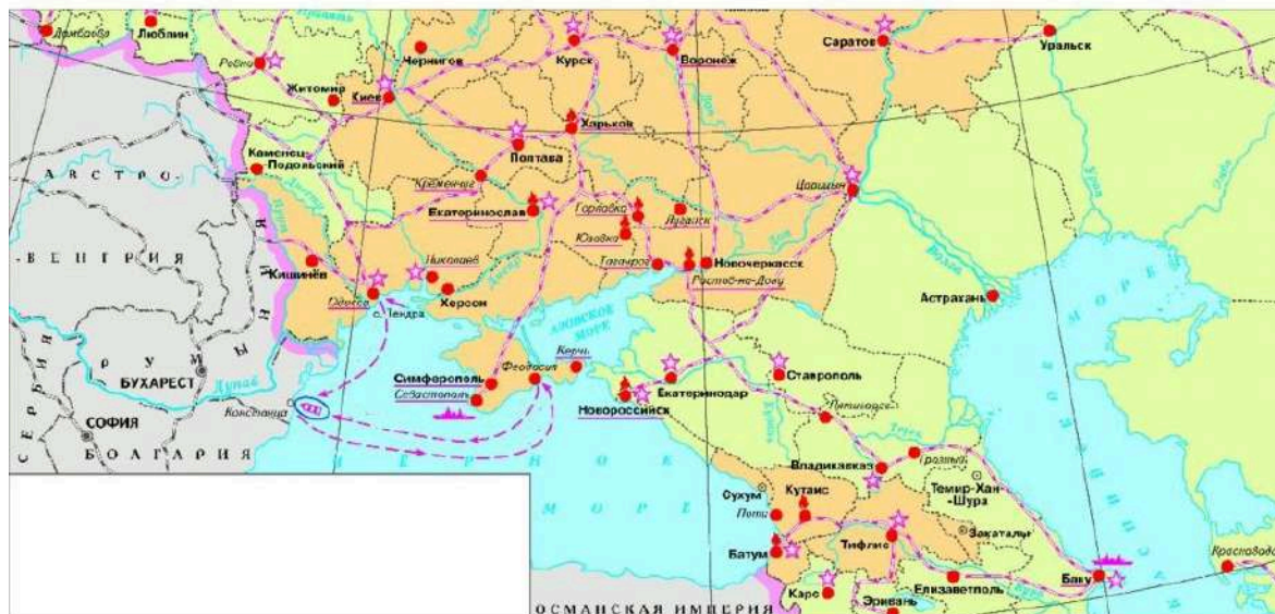
Карта событий периода Первой русской революции