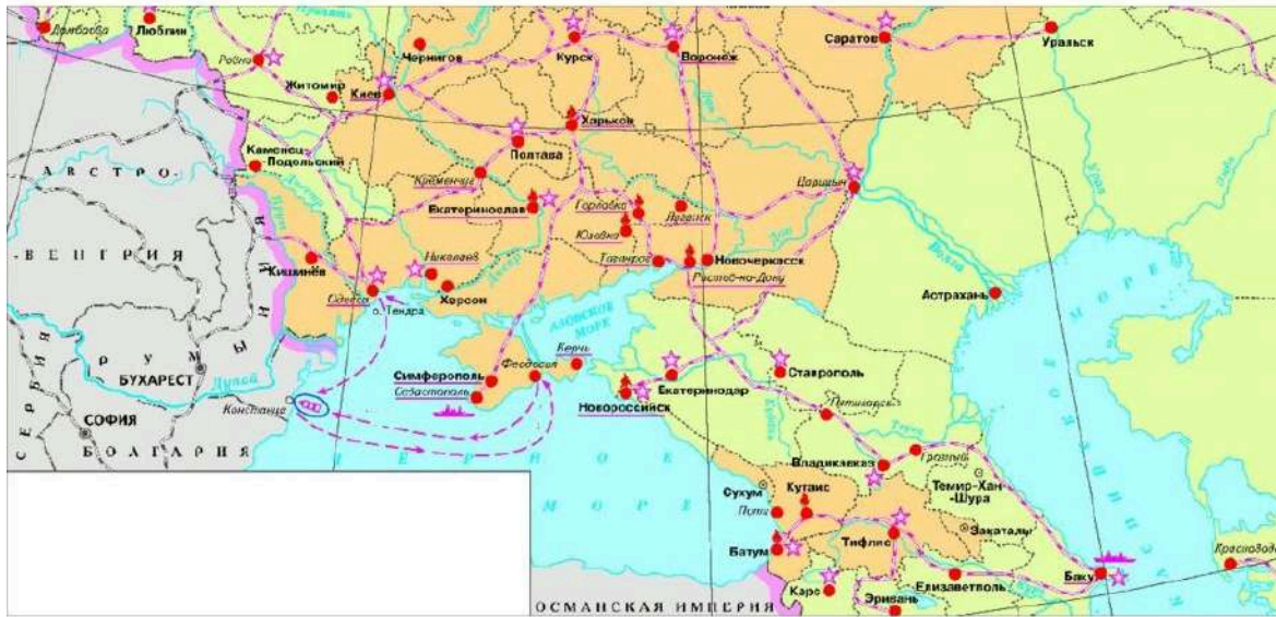
Карта событий периода Первой русской революции